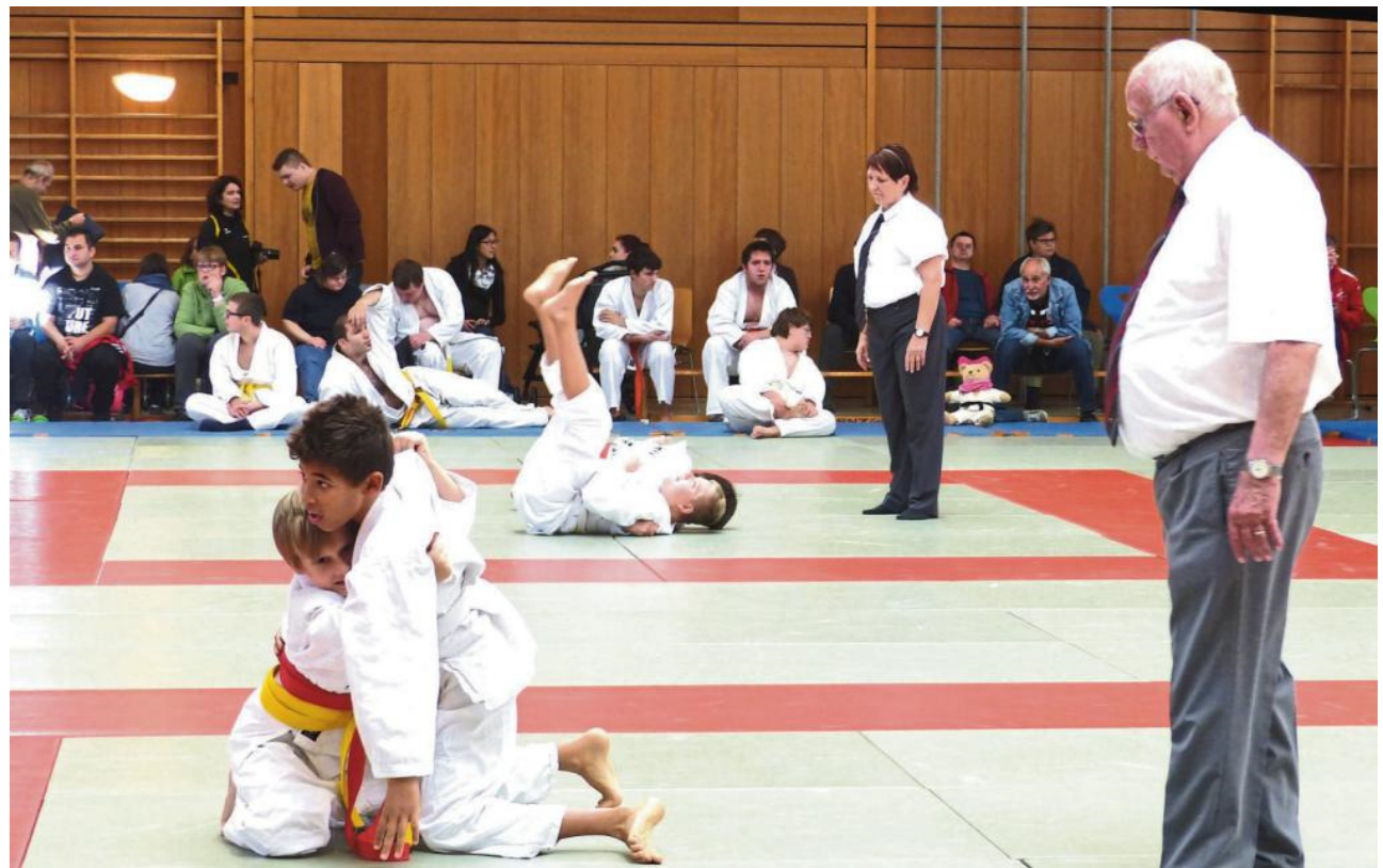
BEI DEN OFFENEN LANDESMEISTERSCHAFTEN für Judokas mit Handicap war die Altersspanne der Teilnehmer groß. Die Jüngsten waren Sportler im Grundschulalter.